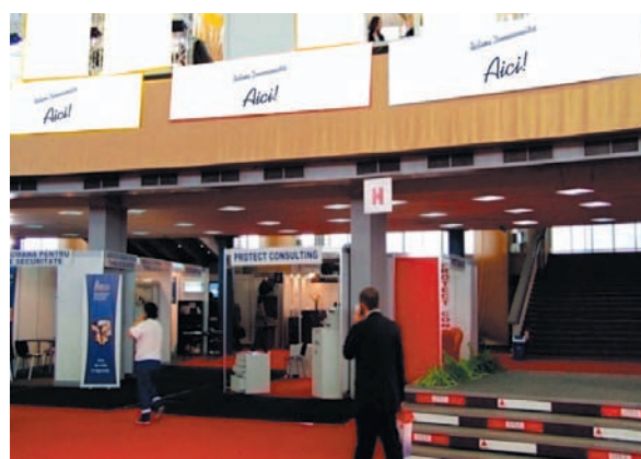
AFISARE BANNERE PAVILION A, FRIZA 4.50