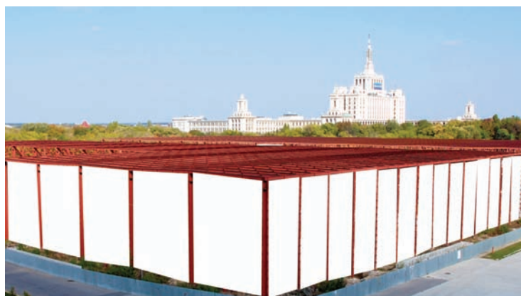
AFISARE BANNERE PAVILION B