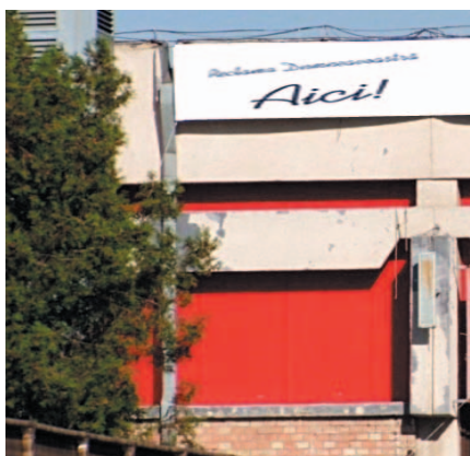
AFISARE BANNERE PE FATADA PAVILIONULUI C4