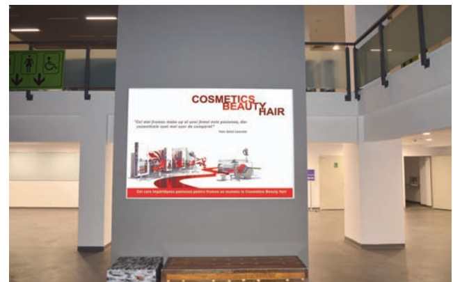
CASETA CU RAMA CLICK, DIMENSIUNE 200X140 CM