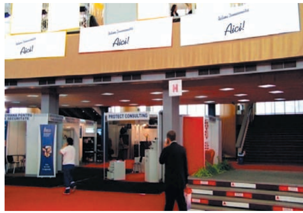
AFISARE BANNERE PAVILION A, FRIZA 4.50