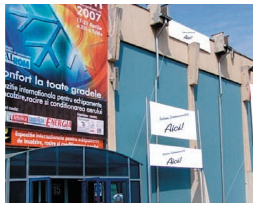
AFISARE BANNERE PE FATADA PAVILIONULUI C1